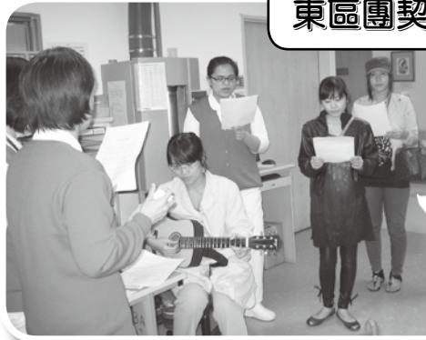
東區團契-花蓮小組獻詩 99年4月30日