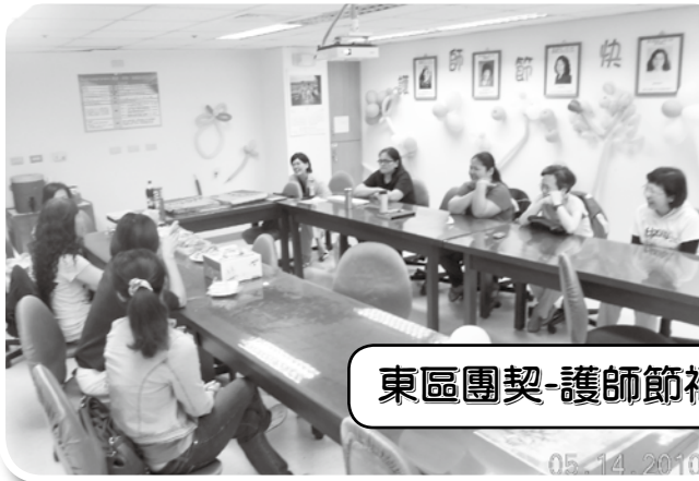
東區團契-護師節福音茶會 99年5月14日