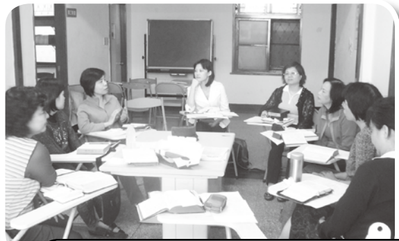
中區團契-查經聚會 99年4月17日