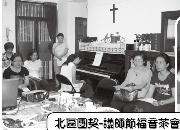
北區團契-護師節福音茶會 99年5月20日