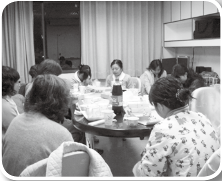
▲台南團契月聚會 (100年3月10日)