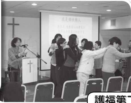
護福第二屆第四次會員大會 100年3月26日